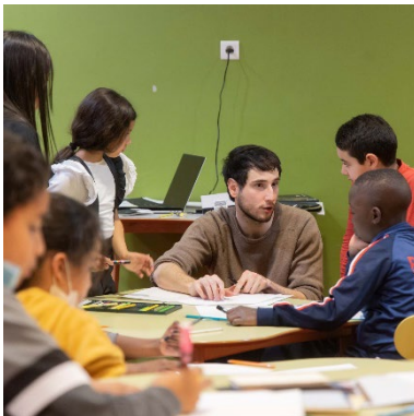
Figure 5 – Atelier

Images de pensée tente d'élaborer une représentation sensible des troubles Dys tels qu'ils sont vécus par chacun·e. Une œuvre plurielle, créée avec différentes personnes concernées, à la croisée de la science, de la créativité artistique et de la sensibilité individuelle et collective.