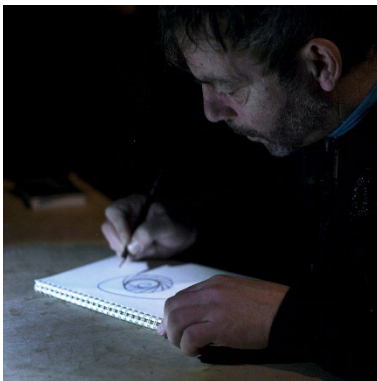
Figure 2 - MOUVEMENT(S) © Judith Arazi

A l'été 2022, un groupe de travail se constitue à la maison d'arrêt des femmes de Fleury-Mérogis à l'invitation de Jules Ramage : femmes détenues, chercheuses spécialisées dans les questions de genre et la linguistique queer, artistes sont invitées à collaborer. Marquées par la sur-médication à laquelle elles sont soumises, les participantes souhaitent explorer les techniques de soin et d'auto-soin qui s'élaborent et circulent à l'intérieur des murs. Des cartes d'entraide sont élaborées à partir de ce corpus d'objets, de gestes, de modes d'emploi, de chansons qui témoignent de pratiques de micro-résistance quotidiennes liées aux relations de sororité, d'amour et de sexualité.