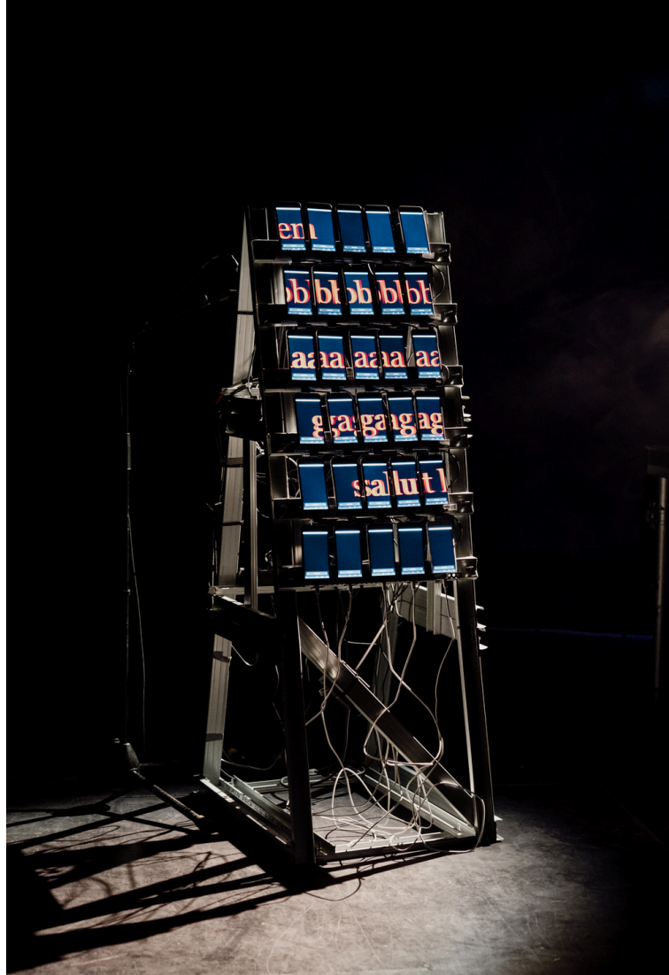
Photo de répétition