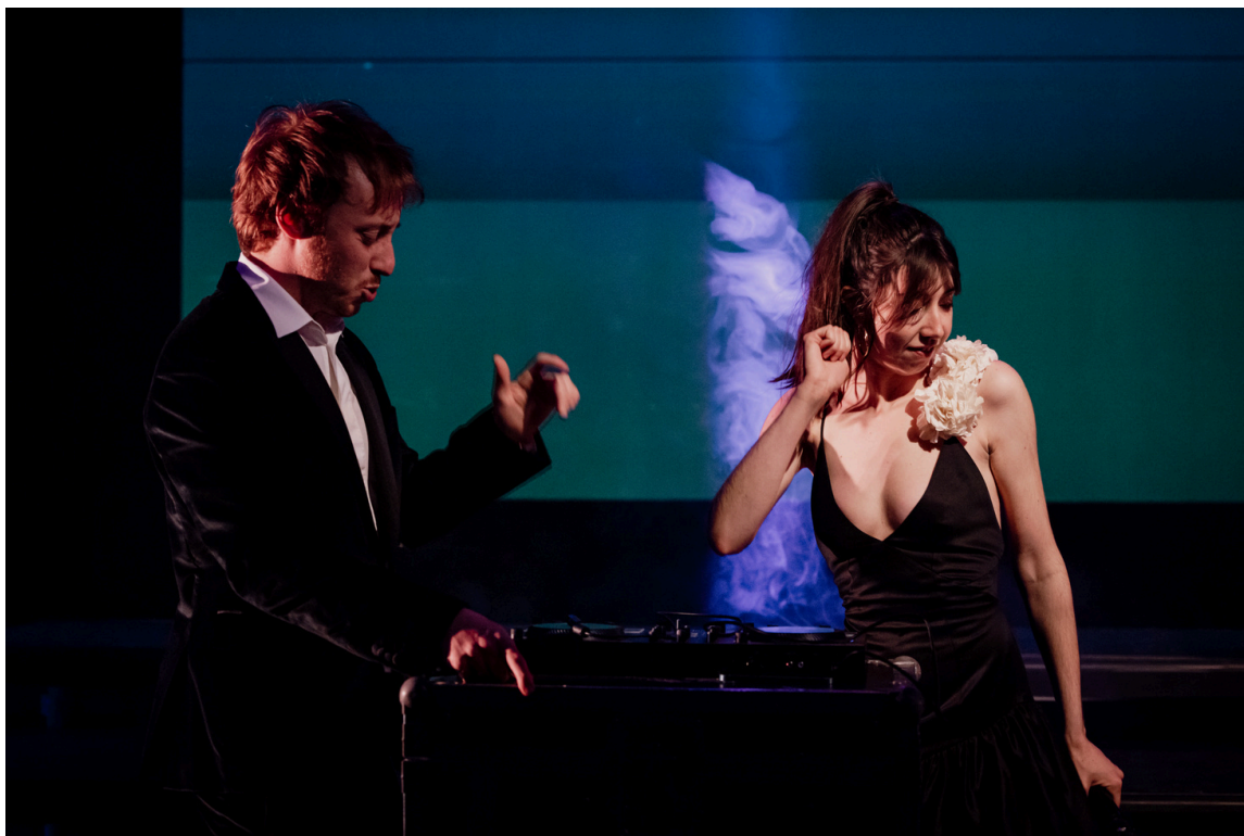
Photo de répétition