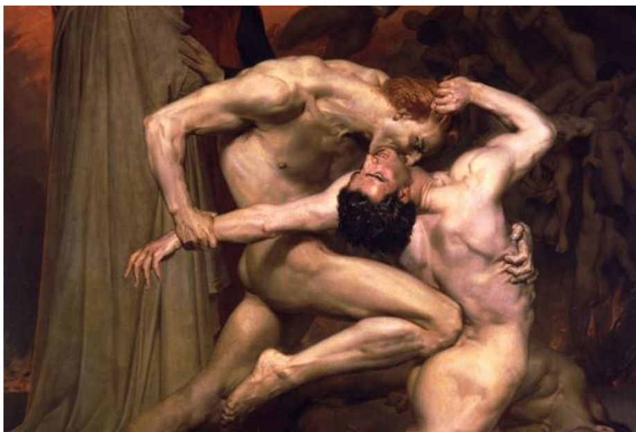
Dante et Virgile aux enfers - William de Bourgeois

Collaboration artistique Louis Arene & Erwan Tarlet