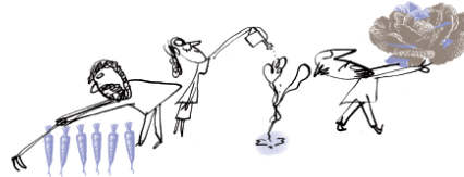
D'autres sont devenus jardiniers et cultivateurs. Ils ont fait pousser des légumes et des fruits, toutes sortes de plantes délicieuses.