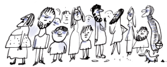
En ce temps-là, il a fallu vivre ensemble. Chacun a dû se mettre à travailler.

Frédéric Boyer est écrivain, traducteur et éditeur. Depuis 1991, il a signé une trentaine de livres, qu'ils soient romans (Prix du livre inter en 1993 pour Des choses idiotes et douces , éditions POL), essais, poèmes ou traductions. Son travail de traducteur l'amène notamment à manier de grands textes anciens. Il a dirigé une nouvelle traduction de la Bible avec la participation d'auteurs contemporains (Olivier Cadiot, Jean Echenoz, Florence Delay, Jacques Roubaud, Valère Novarina...), parue en 2001 (éditions Bayard).