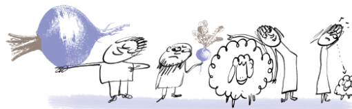
Mais plus les gens travaillaient, plus ils étaient fiers de ce qu'ils faisaient,

Sortie du livre Bible, les récits fondateurs le 29 septembre 2016 (Bayard Éditions).