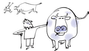
Certains ont apprivoisé et élevé des animaux dans les champs.