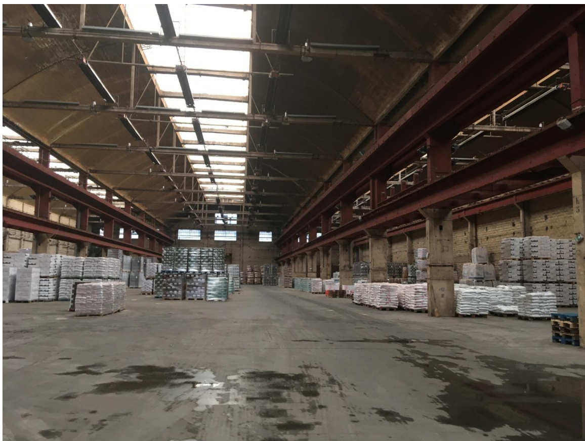
Repérage Triple halle

Le projet de quartier accorde une place importante au développement des métiers de la culture et de la création. Notre groupement assiste le maître d'ouvrage dans la définition du montage du projet et notamment dans les négociations avec les partenaires. Le CENTQUATRE-PARIS a été sollicité pour apporter son regard sur l'ouverture à des usages réversibles et hybrides de la Triple Halle et garantir la forte ambition culturelle et inclusive du projet Babcock.