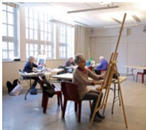
Peindre à 5, 6, 7... - atelier peinture

et Espace Public: Le CENTQUATRE propose un format de résidence artistique s'adressant en priorité aux artistes en pratiques spontanées, pour accompagner leur démarche de création dans le champ des cultures urbaines.